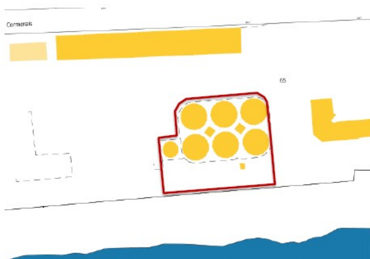
Figure 1 : Plan cadastral de localisation du site